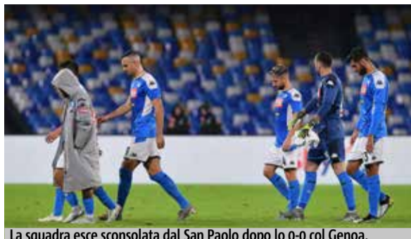
La squadra esce sconsolata dal San Paolo dopo lo 0-0 col Genoa.

NAPOLI - L'azzurro visto al San Paolo nel pareggio contro il Genoa è stato troppo opaco per rianimare una piazza delusa da una stagione fin qui al di sotto delle aspettative e scottata dal fattaccio post-Salisburgo. La reazione non c'è stata: anzi, voci ed eventi fuori dal campo hanno ulteriormente destabilizzato un ambiente che da settimane non ha pace. Il furto in casa Allan e quello subito dalla compa-