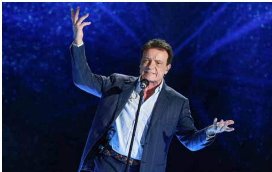
Massimo Ranieri ha vinto il Festival di Sanremo nel 1988 con "Perdere l'amore".

I suoi concerti non si limitano a portare sul palco delle canzoni, ma sono dei veri e propri spettacoli.