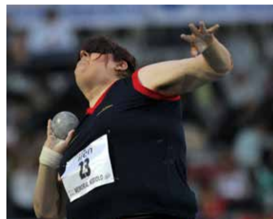
Assunta Legnante, 41 anni, è originaria di Frattamaggiore.

Assunta Legnante è un orgoglio per l'Italia e per Napoli ed è reduce da un bis prestigioso: titolo sia nel lancio del peso (quarto oro consecutivo) che nel disco ai Mondiali Paralimpici di Dubai (una prima volta, invece). La perdita della vista accusata nel 2009 non l'ha fermata, anzi. L'atleta di Frattamaggiore è tornata in pedana e ha ripreso a macinare successi. Lione, Doha, Berlino; la doppietta olimpica di Londra e Rio, ora Dubai: quello di "Assuntina" è un viaggio tra record e limiti superati, che nemmeno un glaucoma congenito è riuscito a interrompere.