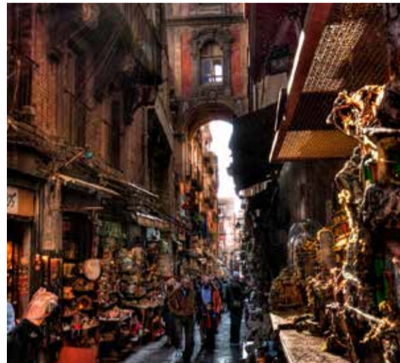
È iniziata la 148esima edizione della fiera di San Gregorio Armeno.

Armeno, la via che con i suoi presepi ogni anno attira turisti da tutto il mondo, ha aperto la 148esima edizione della fiera di Natale, vestendosi a festa con luci e addobbi. In città ci si aspetta una vera e propria invasione di turisti per le feste. Secondo Momondo.it, piattaforma online per la ricerca di voli e hotel, Napoli è la meta preferita dagli italiani per le feste natalizie di quest'anno.