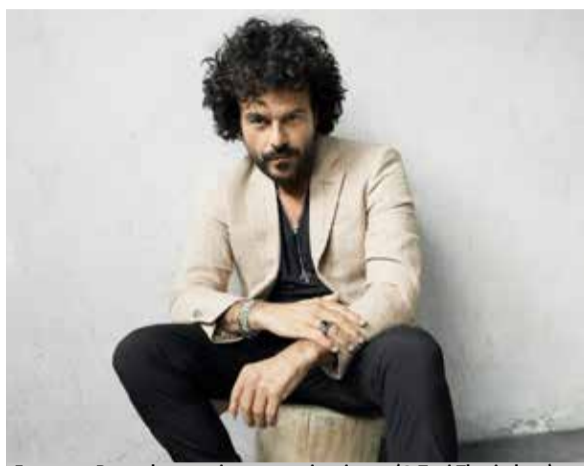
Francesco Renga ha compiuto 51 anni a giugno.

Francesco Renga sarà al Teatro Augusteo con il tour che ripercorre la sua carriera. Salirà sul palco il 18 e il 19 novembre cantando le tracce dell'album "L'altra metà"