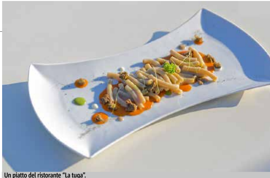
Un piatto del ristorante "La tuga".

Gourmet ma semplice, con attenzione alla carne alla brace.