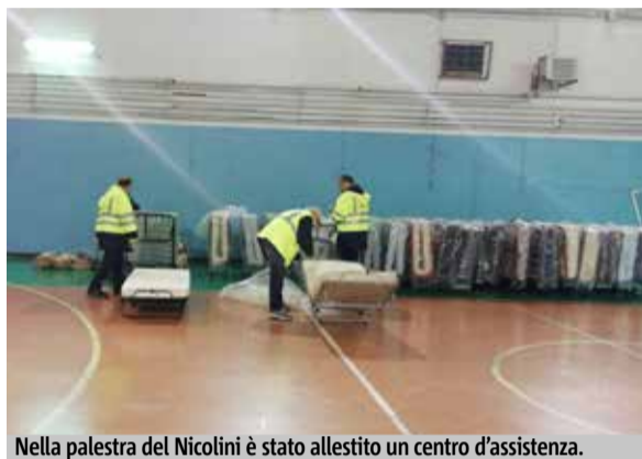
Nella palestra del Nicolini è stato allestito un centro d'assistenza.

Evacuate più di 30 famiglie ai Ponti Rossi, mentre le scuole continuano a restare chiuse. Forti le polemiche da parte dei genitori