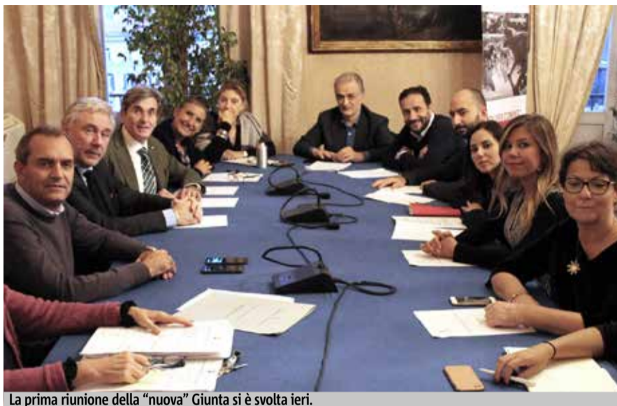
La prima riunione della "nuova" Giunta si è svolta ieri.