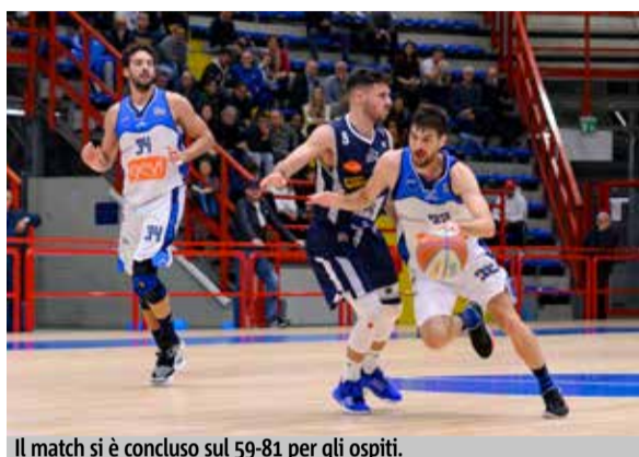
Il match si è concluso sul 59-81 per gli ospiti.

Contro Treviglio è arrivata una brutta sconfitta nonostante il grande pubblico del PalaBarbuto. La squadra di Sacripanti vuole rifarsi a Bergamo