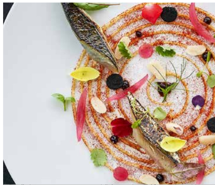
Gli stellati propongono spesso percorsi di degustazione dal forte impatto visivo.

troWeek nell'intervista a lato Domenico Candela) oltre che fare da volano per il giro d'affari. La Guida Michelin è anche la cartina di tornasole per vedere quali aree di un Paese sono più frizzanti e competitive, e l'edizione 2020, presentata pochi giorni fa a Piacenza, ha incoronato la Campania come la terza regione d'Italia per numero di ristoranti stellati, e Napoli come la provincia più titolata dello Stivale, davanti a Roma e Milano. In particolare, sono sei i ristoranti che hanno conquistato l'ambita prima stella, mentre sono quattro quelli che hanno perso quella guadagnata negli anni scorsi. Fra quel-