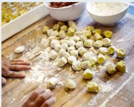
Fino a domani in via Diaz c'è Degusta, festival dello street food.

Dal festival dello street food alla fiera di settore, il cibo continua a essere protagonista a Napoli. Fino a domani continua l'appuntamento con "Degusta", la festa dello street food dedicata ai profumi e sapori d'autunno. In via Diaz si trovano numerosi stand con prodotti regionali da tutta Italia, da salumi e formaggi a conserve e liquori, e soprattutto delizie tipiche di questa stagione, come castagne, miele e torrone. Anche quest'anno Degusta aderisce al progetto "Scegli Napoli", promosso dal Comune di Napoli per rafforzare l'immagine della città e la contaminazione tra prodotti di altre regioni e i prodotti simbolo della gastronomia partenopea. Nella prossima settimana, da martedì 19 a giovedì 21, arriva alla Mostra D'Oltremare la terza edizione di "Gustus", il primo grande salone professionale dell'agroalimentare e dell'enogastronomia di qualità nel centro del Mediterraneo. Saranno tre giornate ricche di eventi tra convegni, laboratori, show cooking, corsi di aggiornamento e tavole rotonde per gli esperti del settore, italiani e internazionali.