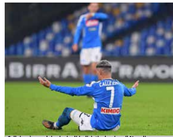
Callejon è uno dei principali indiziati a lasciare il Napoli.

NAPOLI - Uno dei risvolti più significativi che potrà avere la situazione del Napoli è sicuramente quello legato al mercato. Le già delicate trattative per i rinnovi di Mertens e Callejon sarebbero ormai naufragate e il destino dei due appare lontano da Napoli. Diversi giornali parlano di un addio già a gennaio, ma De Laurentiis non vorrebbe smantellare la squadra nel bel mezzo di una stagione che è sicuramente in salita, ma non compromessa. A giugno però la rivoluzione sembra inevitabile: nessun vero intoccabile, il n.1 azzurro non dimenticherà l'ammutinamento e sarebbe pronto ad ascoltare le offerte sia per chi era già con un piede in partenza - vedi Allan - sia per chi fino a poco tempo fa veniva considerato incredibile come Insigne e Koulibaly.