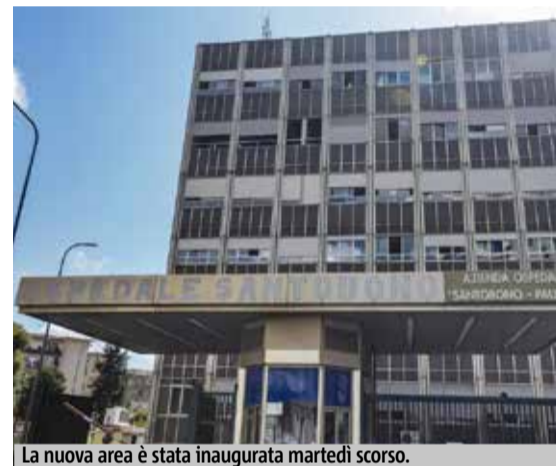
La nuova area è stata inaugurata martedì scorso.

NAPOLI - In inverno il pronto soccorso si riempie di bambini influenzati e spesso le strutture che li accolgono si rivelano inadeguate. Da oggi, però, le famiglie napoletane potranno fare affidamento sul nuovo pronto soccorso Pediatrico dell'Ospedale Santobono, inaugurato dopo due lunghi anni di lavoro. Martedì scorso il cardinale Sepe e il presidente della Regione Vincenzo De Luca hanno tagliato il nastro della nuova area di emergenza, che accoglierà 100mila pazienti all'anno. Numeri record che classificano la struttura come primo pronto soccorso d'Italia ed Europa per numero di accessi. «Sarà una svolta storica per la Campania - ha dichiarato De Luca annunciando l'uscita dal commissariamento -. Da oggi potremo camminare a testa alta in Italia».