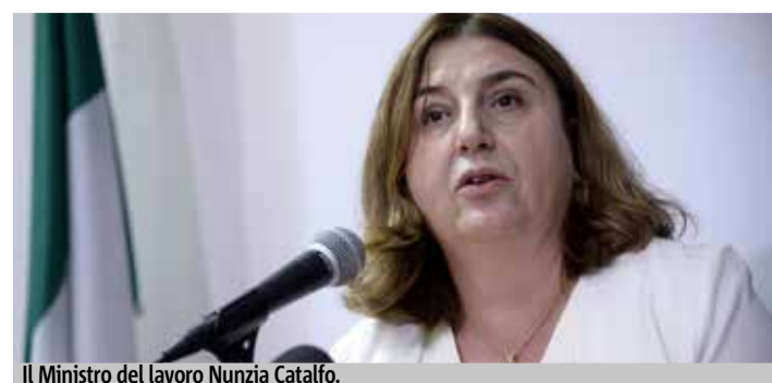
Il Ministro del lavoro Nunzia Catalfo.

NAPOLI - «La situazione dei navigator della Campania si è sbloccata, quindi Anpal nei prossimi giorni provvederà alla contrattualizzazione». È la ministra del lavoro e delle politiche sociali Nunzia Catalfo a mettere la parola fine sulla vicenda dei navigator della nostra regione. I 471 campani, che assisteranno i percettori del reddito di cittadinanza nel trovare un'occupazione, saranno assunti direttamente da Anpal con un contratto di due anni e non dalla regione Campania, come invece avvenuto per le altre regioni dello Stivale, ha chiarito ieri la Catalfo a margine di un convegno a Napoli. È terminato quindi l'infinito ping pong di responsabilità sull'asse Roma-Napoli: i navigator campani avevano tirato un sospiro di sollievo dopo l'incontro fra De Luca e Mimmo Parisi (Anpal) del 17 ottobre, salvo rimanere interdetti quando l'8 novembre Anpal aveva detto che la Regione si stava rifiutando di procedere alla contrattualizzazione. Il 12 novembre era arrivata una delibera della Regione a recepire l'accordo, ma l'incertezza è stata definitivamente chiarita ieri dalla Ministra.