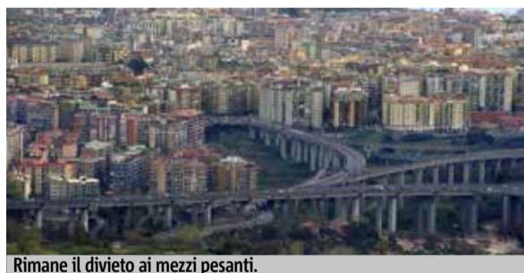
Rimane il divieto ai mezzi pesanti.