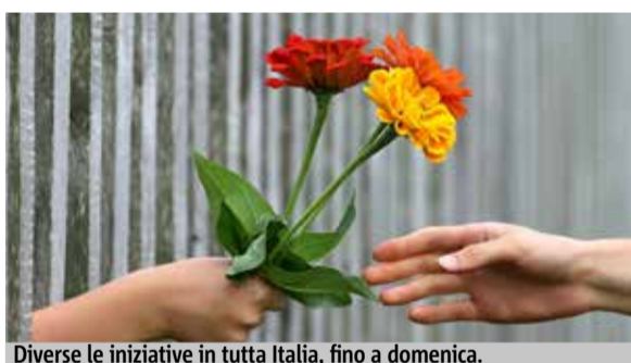
Diverse le iniziative in tutta Italia, fino a domenica.

Da ogni buona azione ne consegue sempre un'altra. È su questo presupposto che si basa il Festival della Gen-